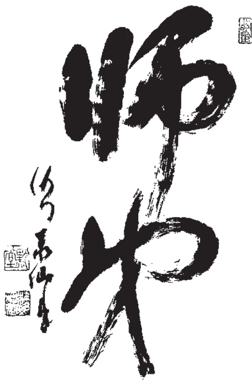
MAÎTRE ET DISCIPLE Calligraphie de Maître Taisen Deshimaru